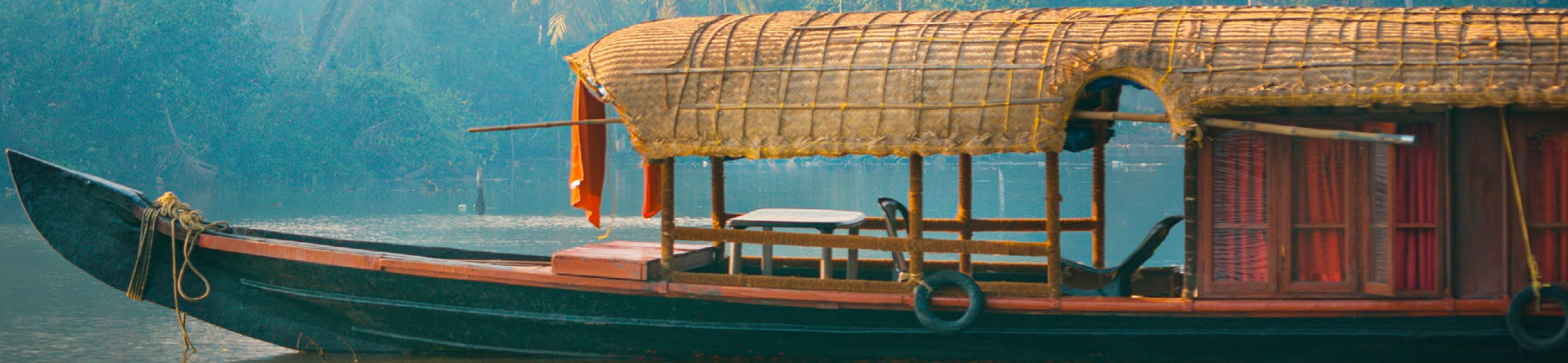
Rév. Rupen Das