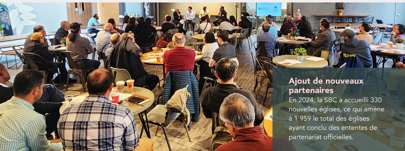
Ajout de nouveaux partenaires En 2024, la SBC a accueilli 330 nouvelles églises, ce qui amène à 1 959 le total des églises ayant conclu des ententes de partenariat officielles.